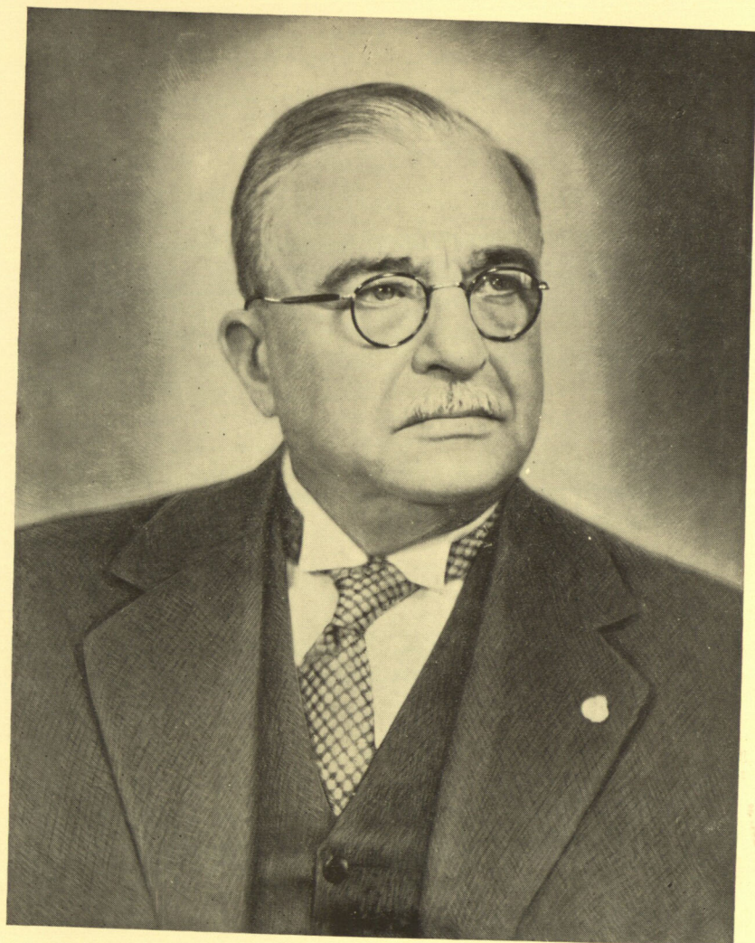
Ο Ιω. Μεταξάς Κυβερνήτης.