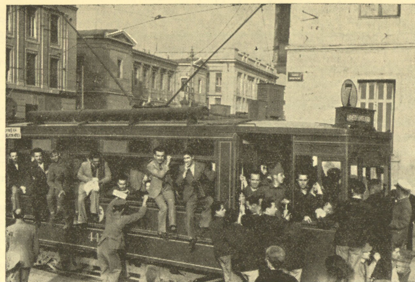
Ἡ ἐπιστράτευσις. Οἱ Ἕλληνες ἐπήγαιναν στὸν πόλεμον αὐτὸν σὰν σὲ πανηγύρι.

Σᾶς ἀπαγορεύω νὰ ἀνακοινώσητε σχετικὰ καὶ τὸ παραμικρὸν σ' ὅποιονδήποτε. Ἀπολύτως καὶ γιὰ οἰονδήποτε λόγον. Κάθε παράβασις αὐτῆς τῆς ἐντολῆς μου θὰ ἔχη διὰ τὸν ὑπεύθυνον—καὶ νὰ εἰσθε βέβαιοι ὅτι θὰ εὑρεθῆ ὁ ὑπεύθυνος—τὰς συνε-