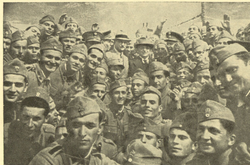
Ὁ Ἰω. Μεταξᾶς σὲ ἓνα στρατῶνα.