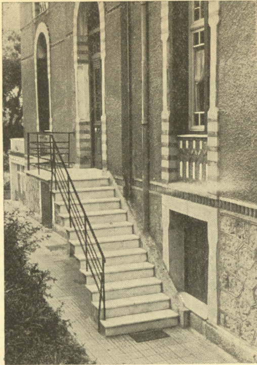
Ἡ πίσω σκάλα τοῦ σπιτιοῦ τῆς Κηφισιάς πού ἀνέβηκε ὁ Γκράτσι καί ἡ πόρτα πού ἀνοίξε αὐτοπροσώπως ὁ Μεταξᾶς.